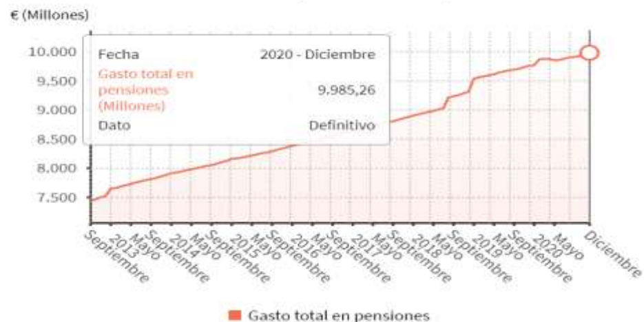
Gasto total en pensiones en España